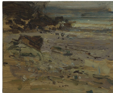
West Portholland 2006-2008 / 48 variaties op een thema / olieverb op paneel / 15,5 x 18,8 cm