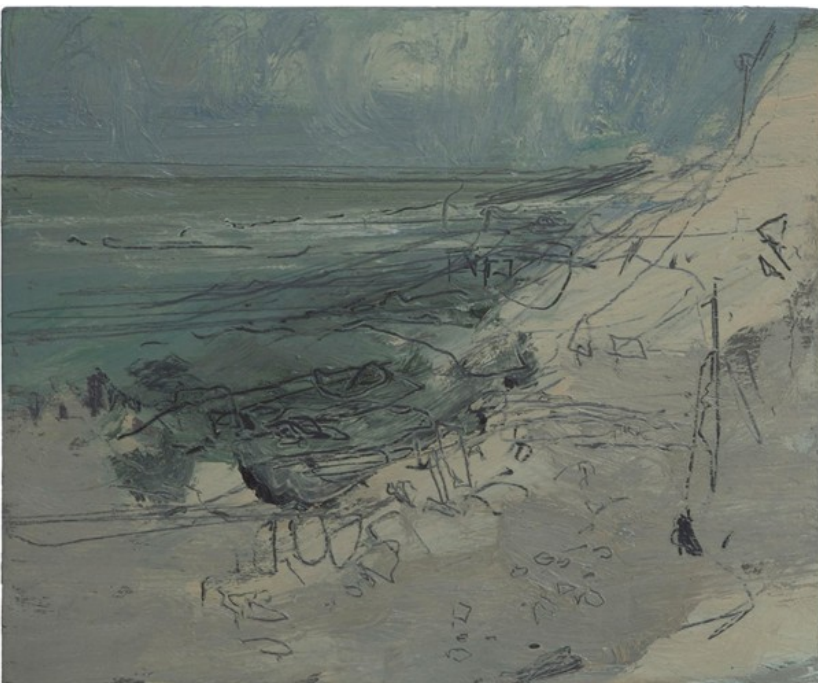
Cran 'd Escalles 2009-2011/24 Variaties op een thema olieverf op paneel/15,5 x 18,8 cm