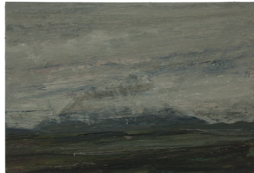
Glen Shiel 2010-2011 / 24 Variaties op een thema / Olieverb op paneel / 15,5 x 22,6 cm