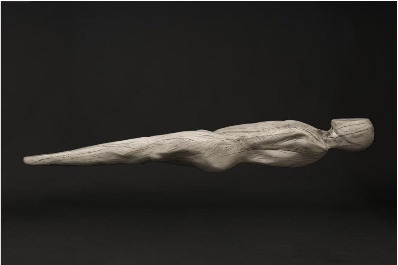
'Greek Ideal', plaster on metal armature with Chinese ink. 180 cm. 2009

open op donderdag, vrijdag en zaterdag van 12u tot 18 u en op afspraak