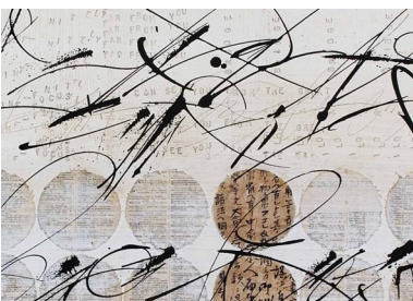
'Untitled' mixed media on paper, 2009