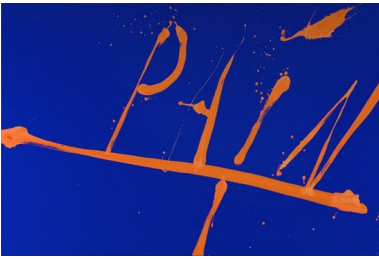
'PainT', oil on canvas, 2008

taal die door de achtergrond van deze werken zwermt, komt men denkbeelden van verstorende diepzinnigheid tegen, die veel basisconcepten overhoop halen. En toch zijn ze aangenaam, en zelfs elegant gepresenteerd, zodat de bittere pil gemakkelijk genomen kan worden. Boven deze minutieuze verhandelingen staan krachtige en opwindende kalligrafische tekens, die energie geven aan de oude en dikwijls uitgeputte filosofieën eronder.