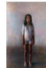
13 | Yam treize ans, 2010 - 2011 207 cm x 130,2 cm olie op doek