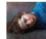
14 | Natan vu de travers, 2013 110,4 cm x 127,5 cm olie op doek