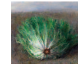
8 | Laitue vue de face, 2011 55 cm x 65 cm olie op doek