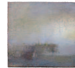
3 | Le mur et la table, 2002 31,7 cm x 36 cm olie op doek