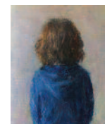
7 | Natan vu de dos, 2013 73 cm x 64,4 cm olie op doek